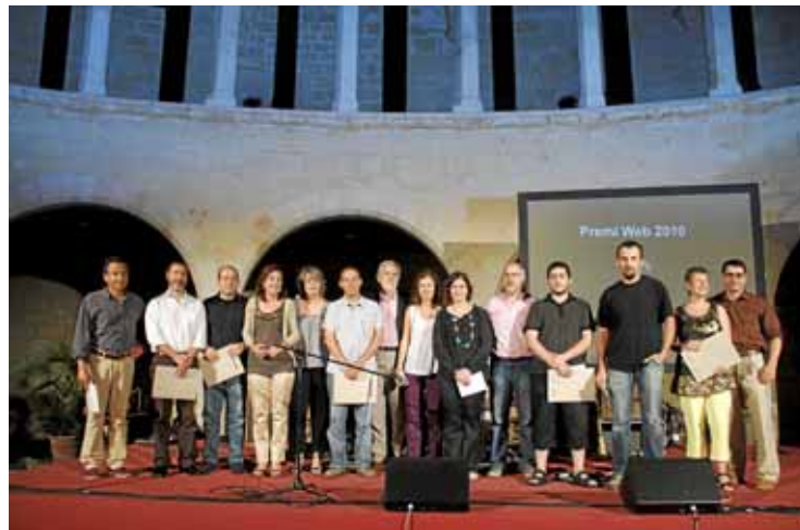
Imatge coral de representants dels webs premiats.

PALMA El proppassat dimecres 9 de juny, foren lliurats al pati d'armes del castell de Bellver els premis Web 2010, tot un reconeixement a alguns dels webs i blogs amb més seguiment realitzats des de les nostres Illes i en la nostra llengua, ja siguin propietat d'institucions i empreses, com de particulars originaris o residents a Balears. Esmentam el seguiment perquè ha estat un factor determinant, ja que enguany els usuaris decidien quines pàgines eren les finalistes, tot i que la darrera pa-